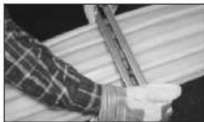
IV. Ścisnąć ze sobą nadtopione końce taśmy na ok. 2 min. IV. Push molten ends of waterstop together.