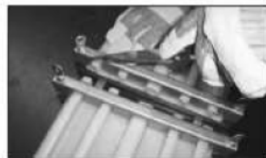
II. Używając ostrych noży równo przyciąć końcówki. Następnie umieścić taśmy w uchwytych pozostawiając końcówki o długości ok. 10mm. II. Using a sharp knife, cut both ends to be welded straight and square. Then locate waterstop in jig, with approx. 10 mm protruding.