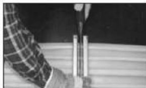
III. Włożyć zgrzewarkę i przycisnąć metalowe uchwyty do siebie. Pozostawić w tej pozycji aż plastik się stopi, pozostawiając szew ok. 5 mm. Usunąć zgrzewarkę. III. Insert hot blade and push waterstop ends against blade. Maintain contact until plastic molds into bead of about 5 mm diameter. Remove knife.