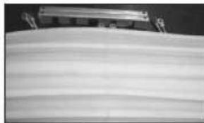
V. Zwolnić uchwyty i zostawić do wystudzenia. Następnie sprawdzić połączenie pod względem ciągłości spoiny i prawidłowego wyrównania kształtu. Jeśli spoina nie spełnia naszych oczekiwań należy powtórzyć operacje I-V. V. Release jig, allow to cool and inspect welded joint for continuity of weld and correct alignment of profiles. If the weld is unacceptable repeat operations I-V.